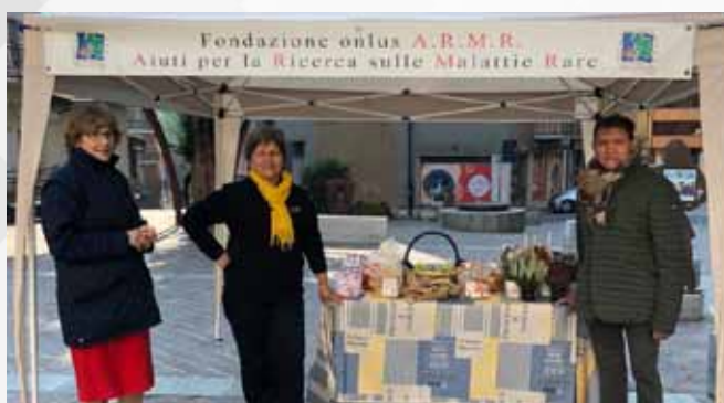
14 OTTOBRE GAZZANIGA