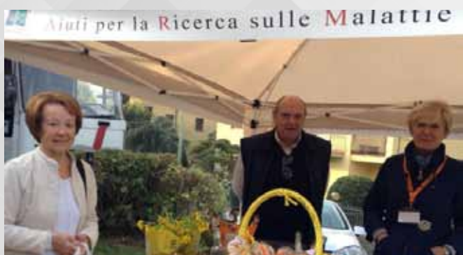
20 SETTEMBRE PONTERANICA