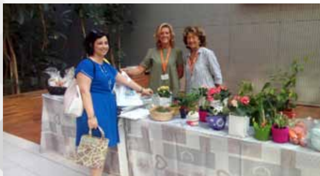
20 SETTEMBRE 2018 OSPEDALE PAPA GIOVANNI XXIII - BERGAMO