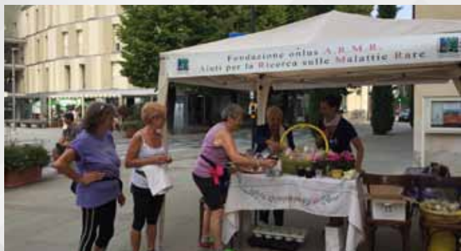
16 SETTEMBRE CURNO