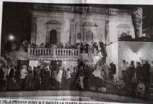
LA VILLA PRIVATA DOVE SI È SVOLTA LA SERATA DI BENEFICENZA